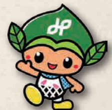
みどりっち 緑区マスコットキャラクター

主催 ● 緑区地域包括ケア推進会議 認知症専門部会 問合せ先 ● 緑区北部いきいき支援センター TEL.899-2002 / FAX.891-7640 ● 緑区南部いきいき支援センター TEL.624-8343 / FAX.624-8361